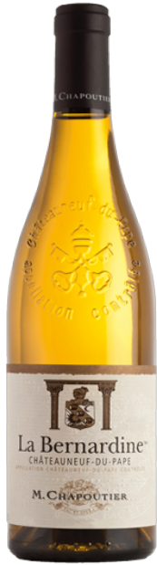
#프랑스 / #유기농